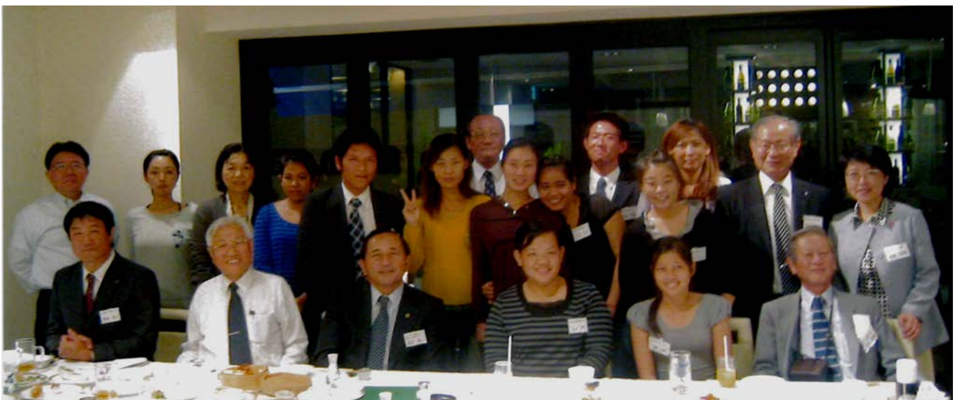
阪神化成工業(株)・(株)タイワ精機/合同歓迎会。カンボジアと中国とそして日本！