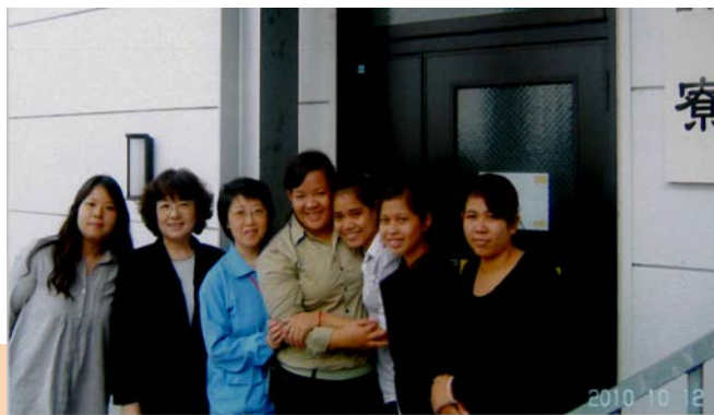
阪神化成工業(株) 真誠寮前にて、来富当日。

ところでしごとによってさいしょにちょっとふあんだったけどげんばにじっせんしてしごとがだんだんなれてきてまえよりうまくできました。でもいつもまだみなさんにごめいわくをかけてしまった。だからこそかいしゃにごめいわくをかけないようにみなさんにもがっかりしないようにがんばっていきます。ほんとうにみなさんにかんしゃしています。